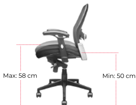
Altura máxima y mínima del asiento

Sistema up & down , el cual permite subir o bajar la altura de la silla a traves de un pistón neumático, que le facilitará posicionarse en la altura deseada o de acuerdo a la estatura de cada usuario.